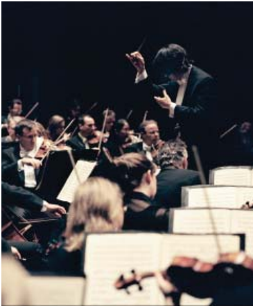
Kent Nagano et l'OSM

Venez vivre avec nous l'enchantement de l'une des plus belles régions du Québec : Lanaudière. Lors d'une journée conçue pour découvrir le riche patrimoine culturel et religieux lanaudois, laissez-vous guider dans l'atelier d'une talentueuse artiste faïencière et dans un symposium de peintures.