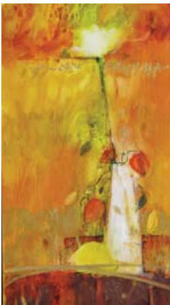
Le solitaire, par Nancy Lajeunesse